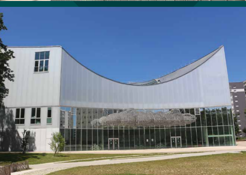
Nouveau conservatoire de Rennes